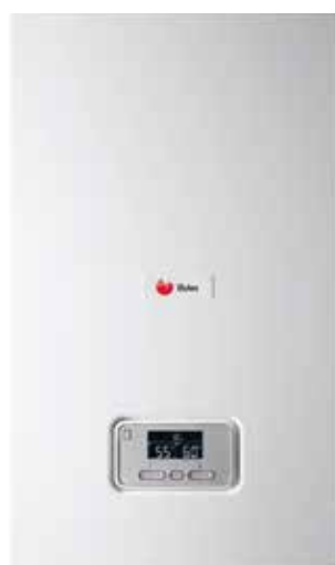
Thema Condens AS 48 - AS 65