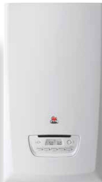
Thema Condens FAS 80