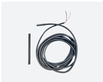
Ressort de fixation inclus